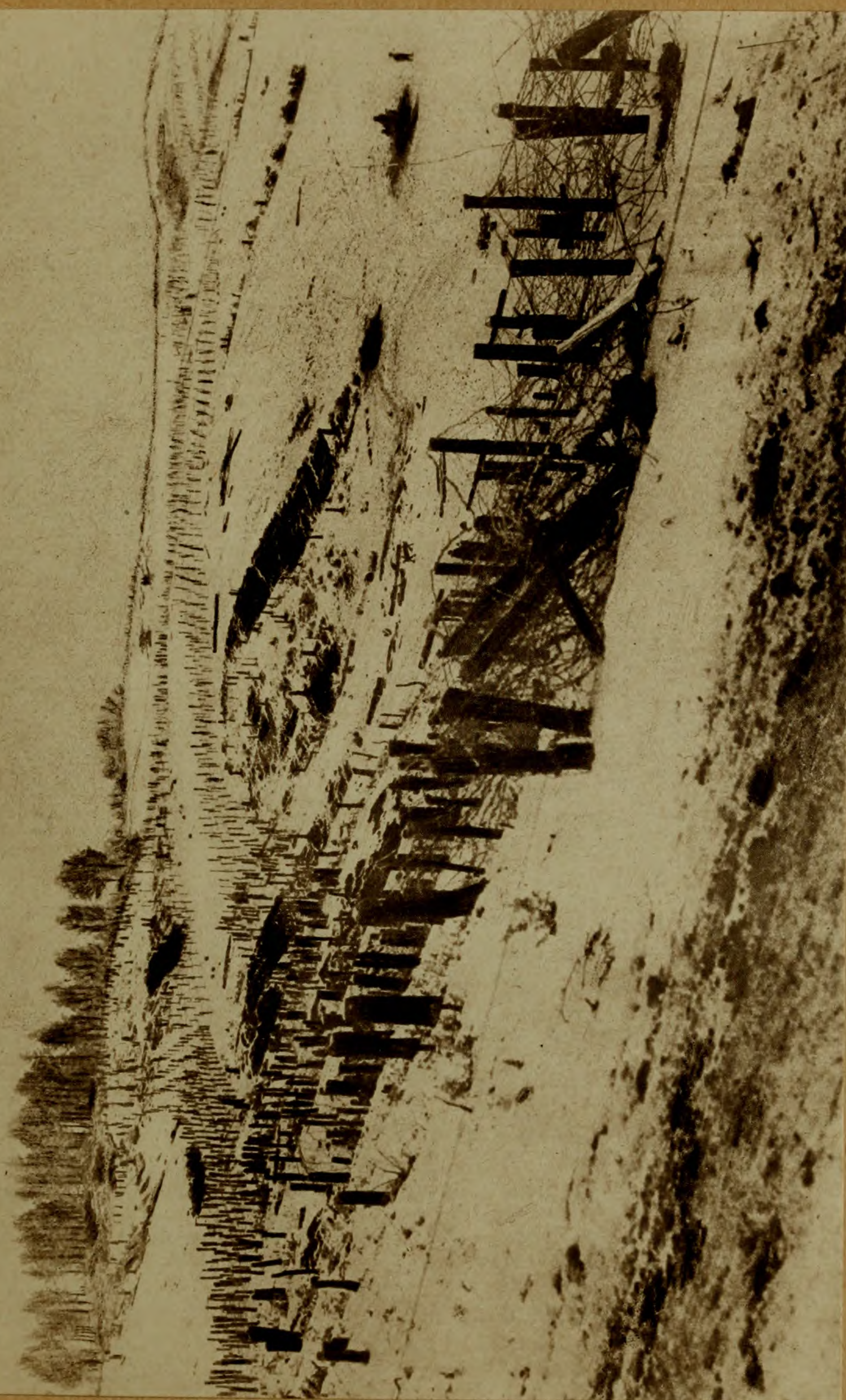
Мѣсто упорныхъ боевъ въ Галиціи.